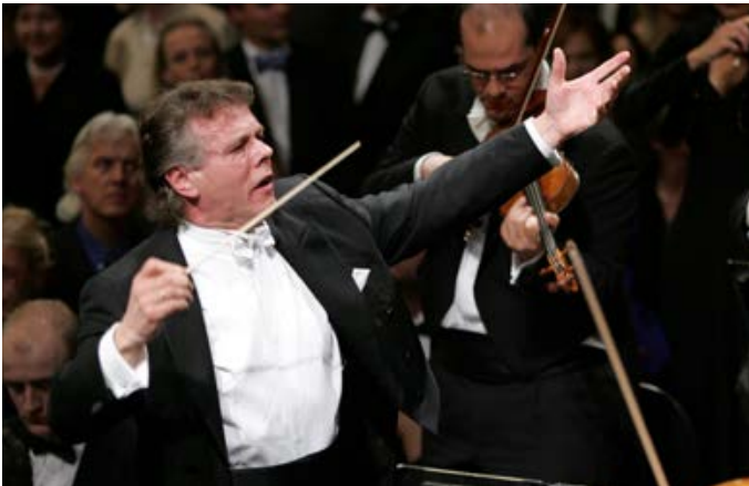
ماريسس يانسونس (Mariss Jansons)

حصل القائد الموسيقي أندريس نيلسونس (Andris Nelsons) على ثلاث منها، أما ماريس يانسونس (Mariss Jansons) فقد حصل على جائزة غرامي واحدة لأفضل أداء أوركسترا. كلاهما معترف بهما من ضمن أفضل خمس قادة موسيقيين في العالم (Bachtrack, ٢٠١٥).