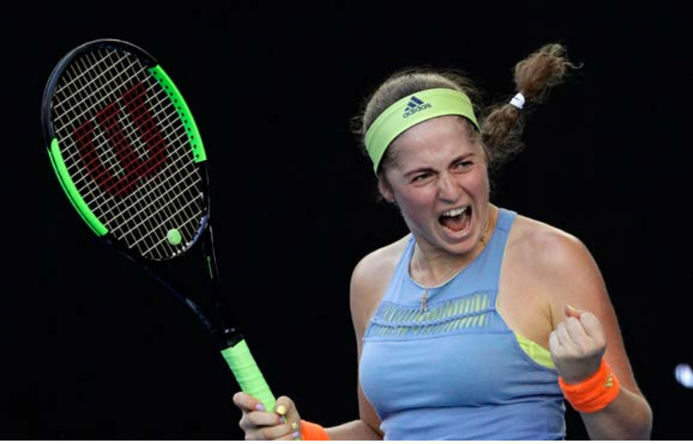
يلينا (أولنا) أوستابينكو (Aļona (Jelena) Ostapenko)