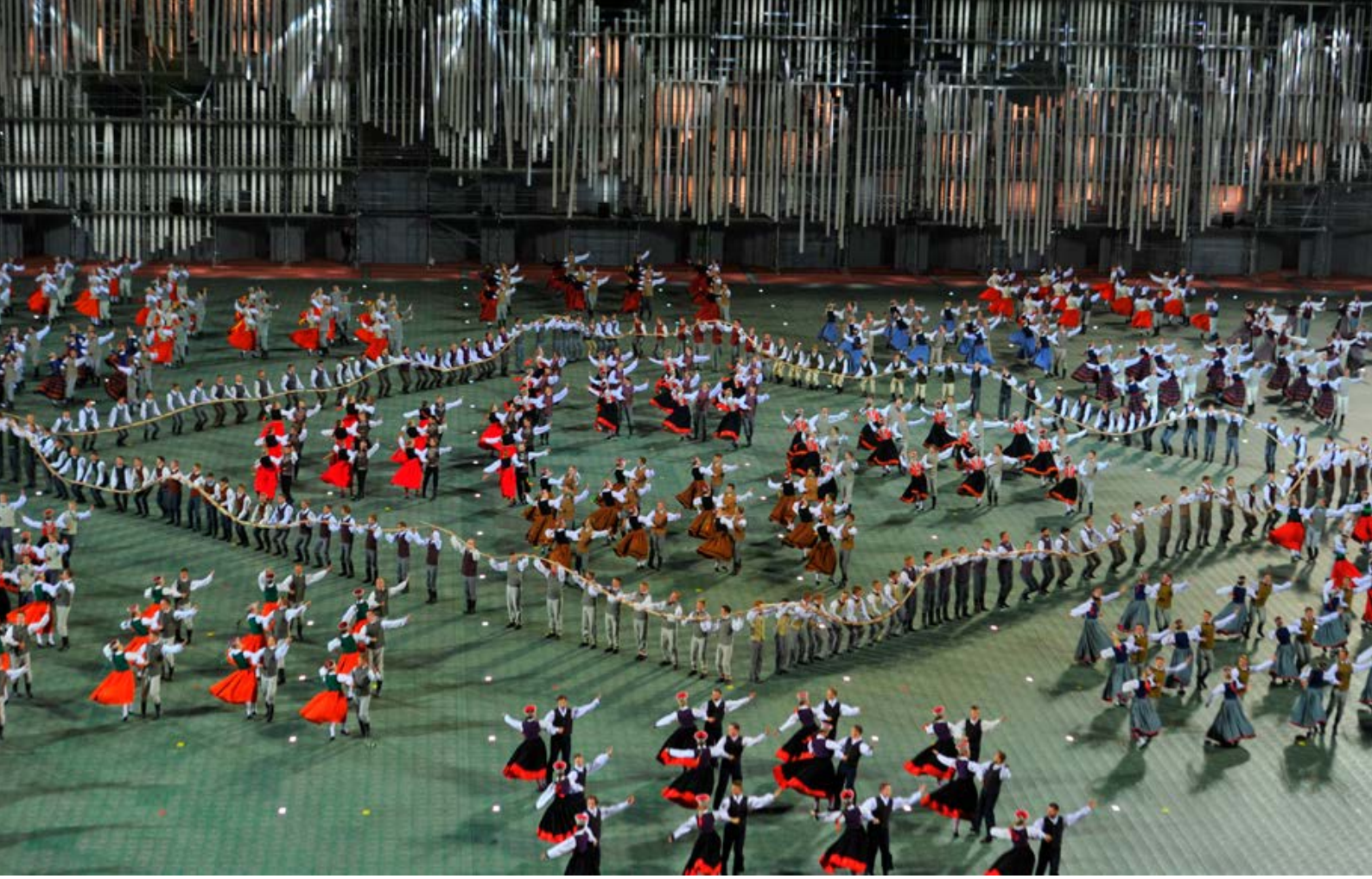
المهرجان اللاتفي للرقص والغناء.