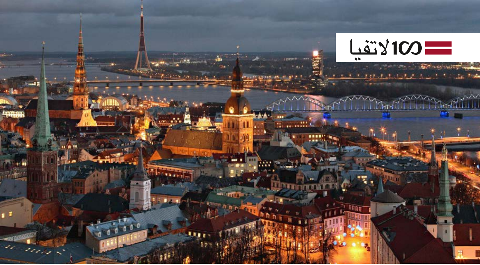
ريغا، تصوير: أليكساندرس كيندينيكوفس (Aleksandrs Kendenkovs)